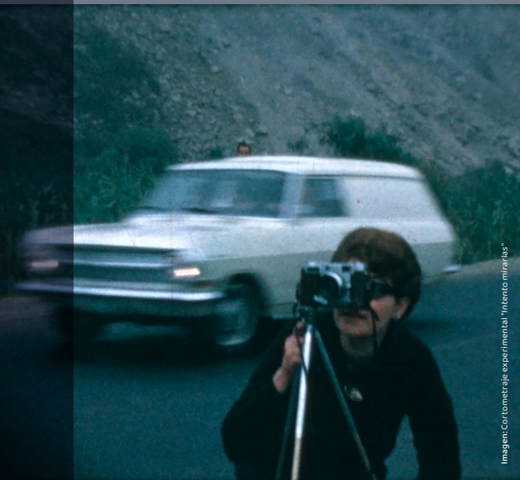
Imagen: Cortometraje experimental "Intento mirarlas"

7 Festival de Cine Hecho por Mujeres y Disidencias