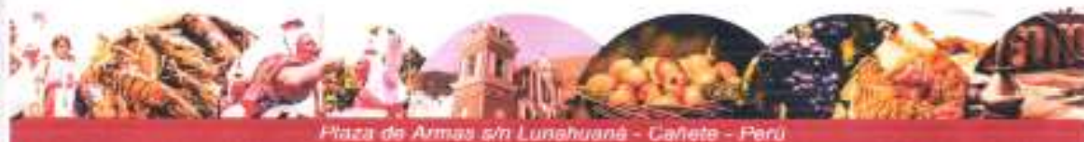
Plaza de Armas s/n Lunahuaná - Cañete - Perú

Distribución: Gerencia Municipal, Oficina General de Administración y Finanzas, Oficina General de Planificación y Presupuesto, Unidad de Tecnología de la Información e Informática.