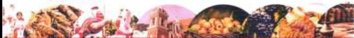
Plaza de Armas s/n Lunahuana - Cañete - Perú

En uso de las facultades conferidas en los artículos 9° y 41° de la Ley Orgánica de Municipalidades N°27972, el Concejo Municipal de la Municipalidad distrital de Lunahuana, por MAYORIA;