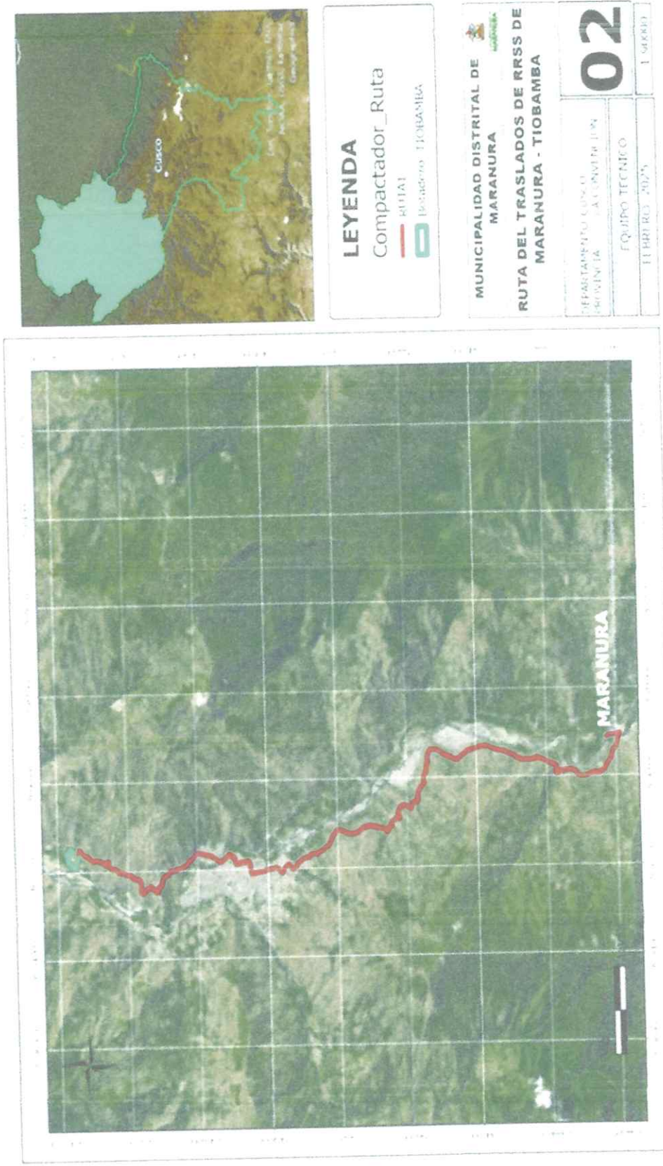
Mapa 2 Ruta de traslado de RRSS de Maranura - Tiobamba

MUNICIPALIDAD DISTRITAL DE MARANURA GERENCIA MUNICIPAL LA CONVENCION V.B. JEFE DE LA OFICINA DE ASISTORIA JURIDICA LA CONVENCION MUNICIPALIDAD DISTRITAL DE MARANURA GERENCIA DE DESARROLLO ECONOMICO Y GESTION AMBIENTAL V.P. LA CONVENCION MUNICIPALIDAD DISTRITAL DE MARANURA OFICINA DE PLANEAMIENTO Y PRESUPUESTO V.P. LA CONVENCION MUNICIPALIDAD DISTRITAL DE MARANURA OFICINA DE PLANEAMIENTO Y PRESUPUESTO V.P. LA CONVENCION