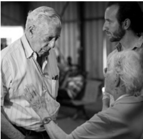
En Cisjordania, 2016

ponen y se resuelven en una mirada ambigua. Puesto que la realidad es excesiva y los personajes buscan llegar a sus límites, el humor es con frecuencia el único modo de dar cuenta de ellos. Pantaleón usa el lenguaje oficial del ejército «el esparcimiento viril», para referirse al servicio de las visitadoras.