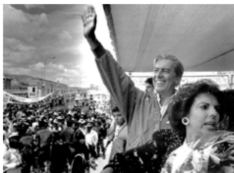
Campaña presidencial, 1990

La óptica desde que se ve a los personajes y las historias también es múltiple. En novelas como Pantaleón y las visitadoras (1973), La tía Julia y el escribidor (1977) y Elogio de la madrastra (1988), la tragedia y la comedia se super-