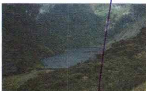
LAGUNA SHIN SHIN