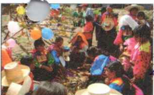
PARADA DE LA YUNZA