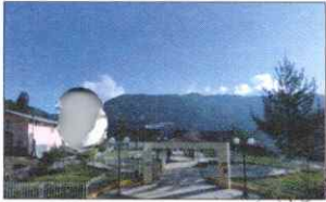
PARQUE PRINCIPAL DE KAÑARIS