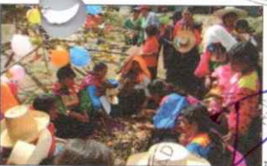
PARADA DE LA YUNZA