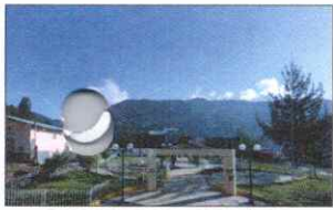
PARQUE PRINCIPAL DE KAÑARIS