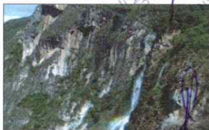
CATARATA EL CHORRO