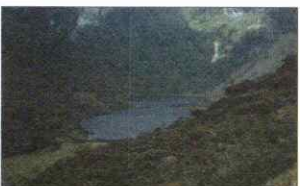
LAGUNA SHIN SHIN