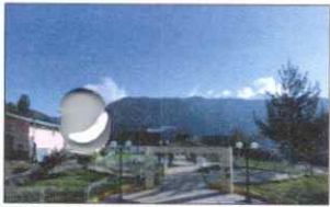
PARQUE PRINCIPAL DE KAÑARIS

ARTICULO SEGUNDO. - DERIVAR , al área de Logística y Patrimonio para que continúe con los procedimientos establecidos dentro del ámbito que rige las Contrataciones del Estado.