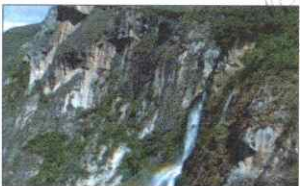
CATARATA EL CHORRO