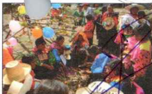
PARADA DE LA YUNZA