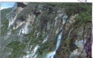
CATARATA EL CHORRO