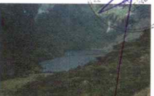
LAGUNA SHIN SHIN