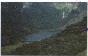
LAGUNA SHIN SHIN