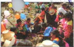
PARADA DE LA YUNZA