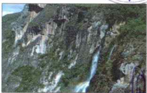
CATARATA EL CHORRO