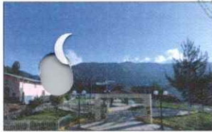
PARQUE PRINCIPAL DE KAÑARIS

6.1. El Plan Anual de Contrataciones es aprobado por el Titular de la Entidad o por el funcionario a quien se hubiera delegado dicha facultad, de conformidad con las reglas previstas en la normatividad del Sistema Nacional de Abastecimiento.