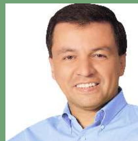
Juan Sotomayor Alcalde del Callao

MUNICIPALIDAD PROVINCIAL DEL CALLAO GERENCIA GENERAL DE ASENTAMIENTOS HUMANOS