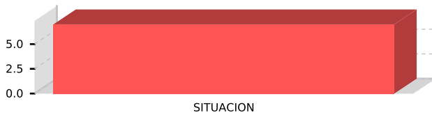
ESTUDIOS DE PREINVERSION