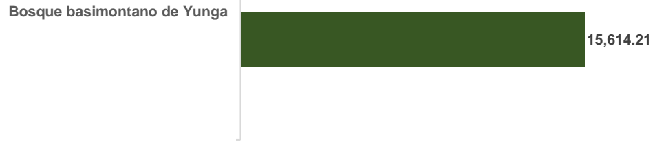
Gráfico N° 1: hectáreas de los ecosistemas del MINAM 2019 en el Acuerdo de Conservación con la comunidad nativa Madre de Dios