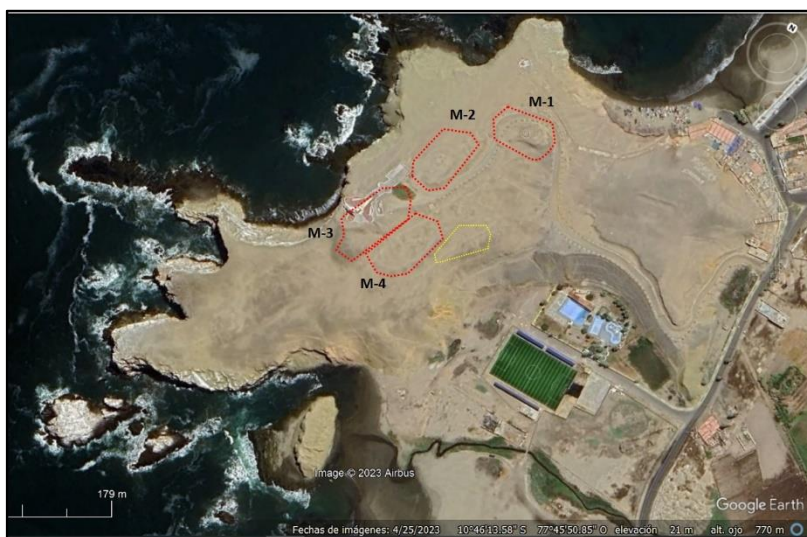
Imagen 1. Sitio arqueológico Cerro Colorado. En líneas rojas los montículos arqueológicos y en línea amarilla la posible cementerio arqueológico.

El sitio arqueológico Cerro Colorado (PV39-288) se ubica en el distrito y provincia de Barranca, departamento de Lima; hacia la margen izquierda de la desembocadura del río Pativilca. Tiene como coordenada UTM de referencia: 19800.20 m Este y 8808244.18 m norte, sobre una altitud de 7 msnm. Se extiende en relación a una formación rocosa denominada “Punta Cerro Colorado”, la cual se encuentra entre las playas Puerto Chico y Colorado. Debemos considerar que el sitio arqueológico originalmente habría abarcado —a lo largo de su ocupación prehispánica— mayor área de la registrada en la actualidad, siendo la zona superior del promontorio Punta Cerro Colorado, donde se ubicaría la mayor presencia de evidencia arqueológica. En este sentido, por el momento en esta zona fueron identificados cuatro montículos arqueológicos, posibles áreas de viviendas y de cementerio (Ver Imagen 1).