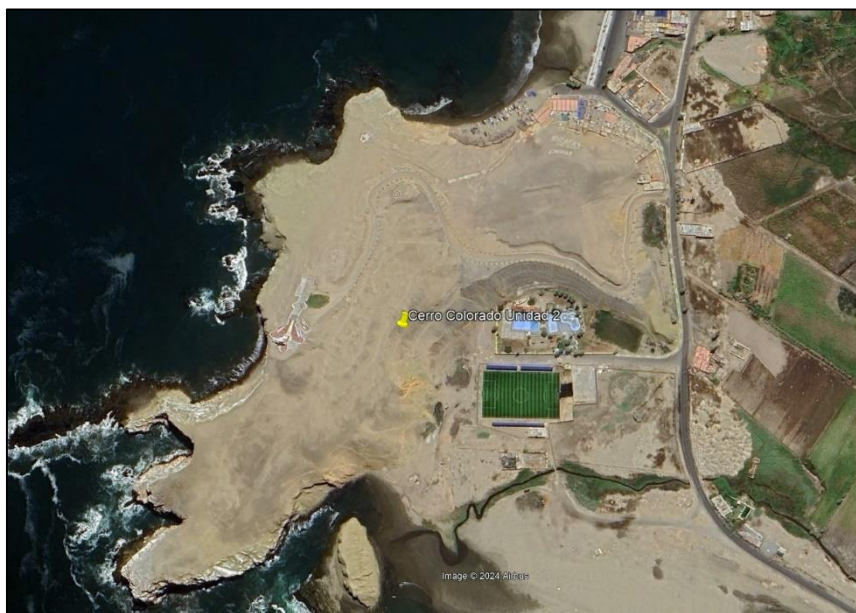
Imagen 2. En amarillo se señalada el lugar donde fueron recuperados los fardos funerarios

A la fecha estos fardos funerarios continúan en análisis por el equipo de antropólogos físicos, pero se han obtenido fechados radiocarbónicos de dos de los fardos registrados, lo cual permite complementar la propuesta de secuencia cronológica realizada en el año 2023.