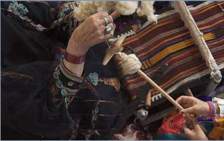
ELABORACIÓN DE TEJIDOS SADU