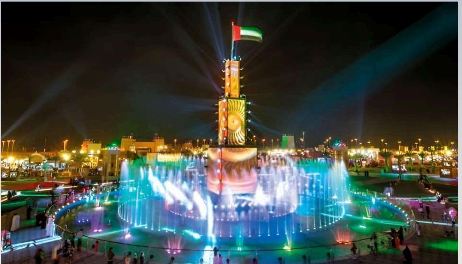
FESTIVAL SHEIKH ZAYED EN ABU DHABI

mensaje de civilización que enriquece el paisaje humano e invita al mundo a una asociación basada en la comprensión y la creatividad compartida.