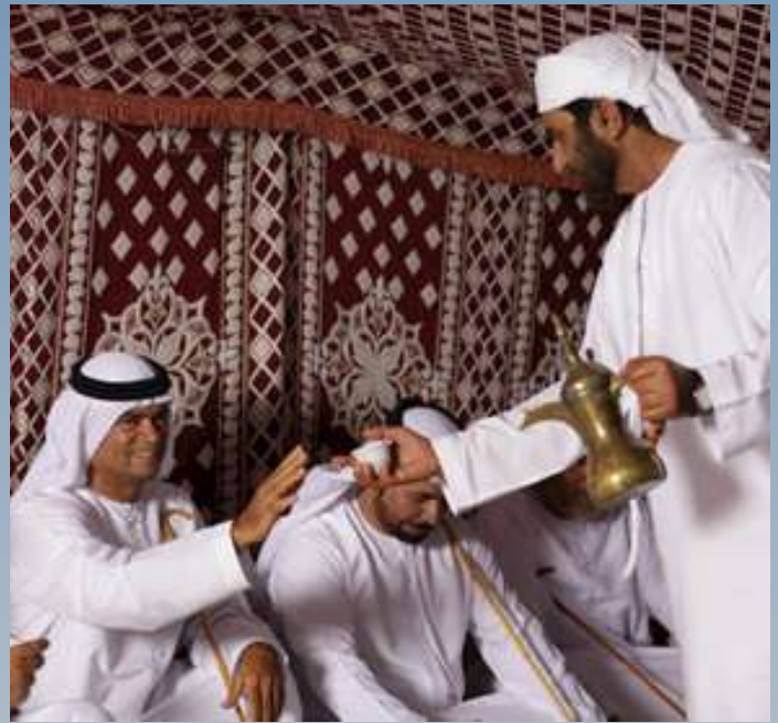
MAJLIS EMIRATÍ, PATRIMONIO CULTURAL POR LA UNESCO DESDE EL AÑO 2015