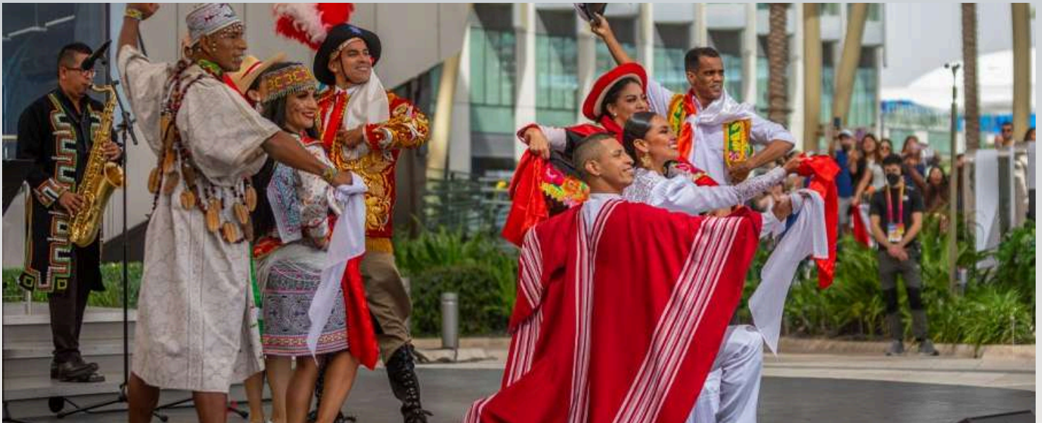
ESPECTACULO "WAYRA" QUE PRESENTÓ DANZAS COMO MARINERA NORTEÑA, IO PATATI, HUAYLARSH DE CARNAVAL Y NEGRERÍA DE YAUYOS.

La música tradicional peruana, en su diversidad de ritmos y estilos, constituye un vehículo de memoria e identidad. Según Chasqui (2023), los instrumentos andinos como la quena, el charango y la zampoña no solo evocan los paisajes del altiplano, sino también una cosmovisión que entiende el sonido como vínculo entre naturaleza y comunidad. En muchas comunidades del sur