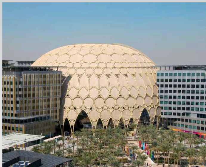
AL WASL PLAZA

Seguidamente, se decidió levantar una ciudadela en medio del desierto sobre un terreno de 438 hectáreas, ubicado en el camino que va de Dubai hacia Abu Dhabi, no muy lejos del importante puerto marítimo de Jebel Ali. El plan maestro, diseñado por la firma norteamericana HOK, se organizó alrededor de una plaza central techada bajo una amplia cúpula, denominada Al Wasl ("la conexión" en idioma árabe), de la cual se proyectaron tres grandes pétalos que conformaron las respectivas grandes áreas temáticas: oportunidad, movilidad y sostenibilidad. Para dotar a dicha ciudadela de la infraestructura requerida, fue menester construir una moderna autopista bien iluminada, una nueva línea de metro, edificaciones para vivienda, locales comerciales, fuentes de energías renovables y una serie de servicios locales.