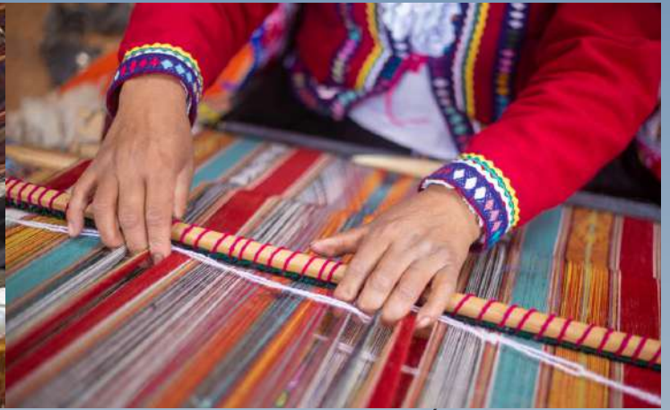
ELABORACIÓN DE TEJIDOS ANDINOS

De modo semejante, en los Emiratos la caligrafía, el tejido de palma y la orfebrería conservan el valor de lo hecho a mano como expresión de identidad. Estas afinidades permiten imaginar proyectos curatoriales conjuntos centrados en la memoria, la sostenibilidad y la belleza del trabajo artesanal. En ambos contextos, el arte se erige como lenguaje universal capaz de tender puentes entre tradición y contemporaneidad (Chasqui, 2023).