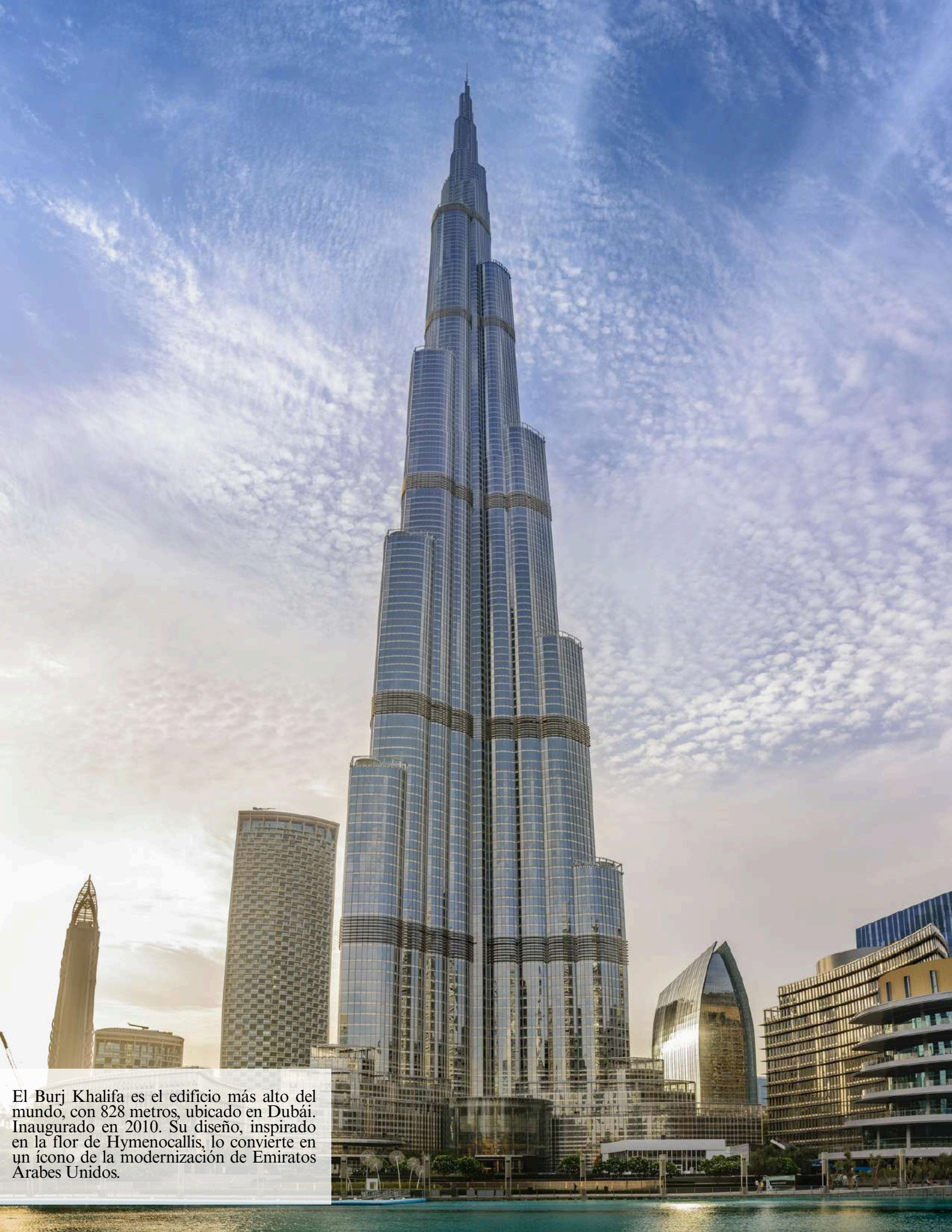
El Burj Khalifa es el edificio más alto del mundo, con 828 metros, ubicado en Dubái. Inaugurado en 2010. Su diseño, inspirado en la flor de Hymenocallis, lo convierte en un ícono de la modernización de Emiratos Arabes Unidos.