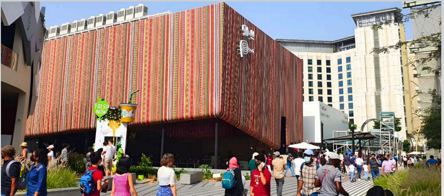
PABELLÓN DEL PERÚ EN LA EXPO DUBAI 2020

Es importante destacar que el pabellón peruano fue un importante punto de contacto comercial entre las pymes de las diferentes regiones del Perú y empresarios