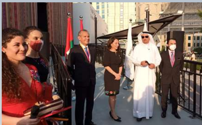
CELEBRACIÓN DEL DÍA DEL PERÚ EN LA EXPO DUBAI 2020, ENCABEZADA POR LA COMISIONADA GENERAL Y PRESIDENTA EJECUTIVA DE PROMPERÚ Y AUTORIDADES PERUANAS.

De otro lado, la gestión del pabellón peruano cuenta con un registro óptimo de cumplimiento de normas y exigencias por parte de la organización local de la EXPO DUBAI, no habiendo tenido ninguna observación durante los 6 meses de funcionamiento.