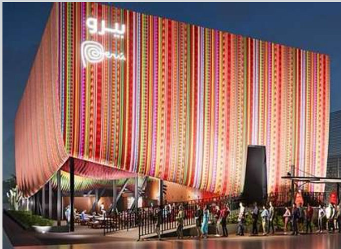
EL PABELLÓN DEL PERÚ EN LA EXPO DUBÁI 2020,

Durante Expo 2020 Dubái, el Pabellón del Perú integró la gastronomía como elemento central de su narrativa cultural. Se registró que más de