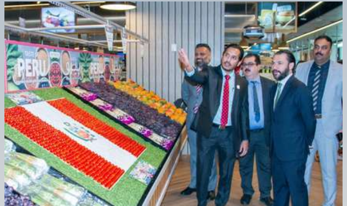
EL EVENTO "TASTE OF PERU", ORGANIZADO POR EL GRUPO LULU Y PROMPERÚ DUBÁI, BUSCA IMPULSAR LA IMPORTACIÓN DE PRODUCTOS PERUANOS EN EL GOLFO PÉRSICO.

Las iniciativas de retail diplomacy han sido otro pilar fundamental. La campaña "Taste of Peru" en colaboración con LuLu Group, la principal cadena de supermercados de los EAU, permitió la introducción de 40 nuevos productos peruanos al mercado emiratí (PROMPERÚ, 2022). En noviembre de 2025, con la apertura de la Embajada del Perú en Abu Dabi, el evento Taste of Peru ha retomado su nombre como una experiencia multigestonómica y cultural integral.