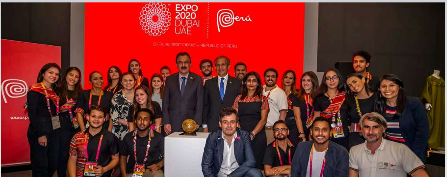
EL PERÚ GANÓ EL TROFEO DE ORO AL MEJOR DISEÑO DE EXHIBICIÓN EN LA CATEGORÍA DE PABELLONES PROPIOS CONSTRUIDOS DE TAMAÑO INTERMEDIO

La activa presencia del restaurante Qoricancha, ubicado en la primera planta de nuestro pabellón peruano, logró difundir adecuadamente los diversos sabores de todas las regiones peruanas, al igual que los superalimentos oriundos del Perú. El consorcio DP World fue un importante socio para nuestra participación en la EXPO DUBAI, pues contribuyó con el transporte del material empleado y exhibido en dicho espacio. Gracias a ello, la gastronomía peruana ha potenciado la presencia que ya tenía en EAU.