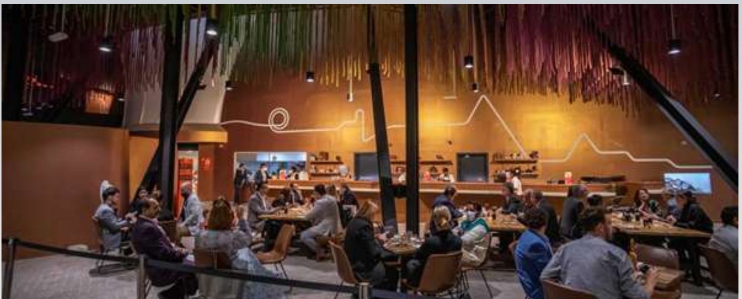
CENA DE LA ALIANZA DEL PACÍFICO

El martes 8 de febrero de 2022, tuvo lugar en el pabellón peruano en la EXPO DUBAI una cena de gastronomía amazónica peruana, ofrecida para más de 40 invitados con ocasión de conmemorarse un aniversario más de la declaratoria de las "Siete Maravillas Naturales del Mundo", por parte de la Fundación "New 7 Wonders", una de las cuales es precisamente el río Amazonas.