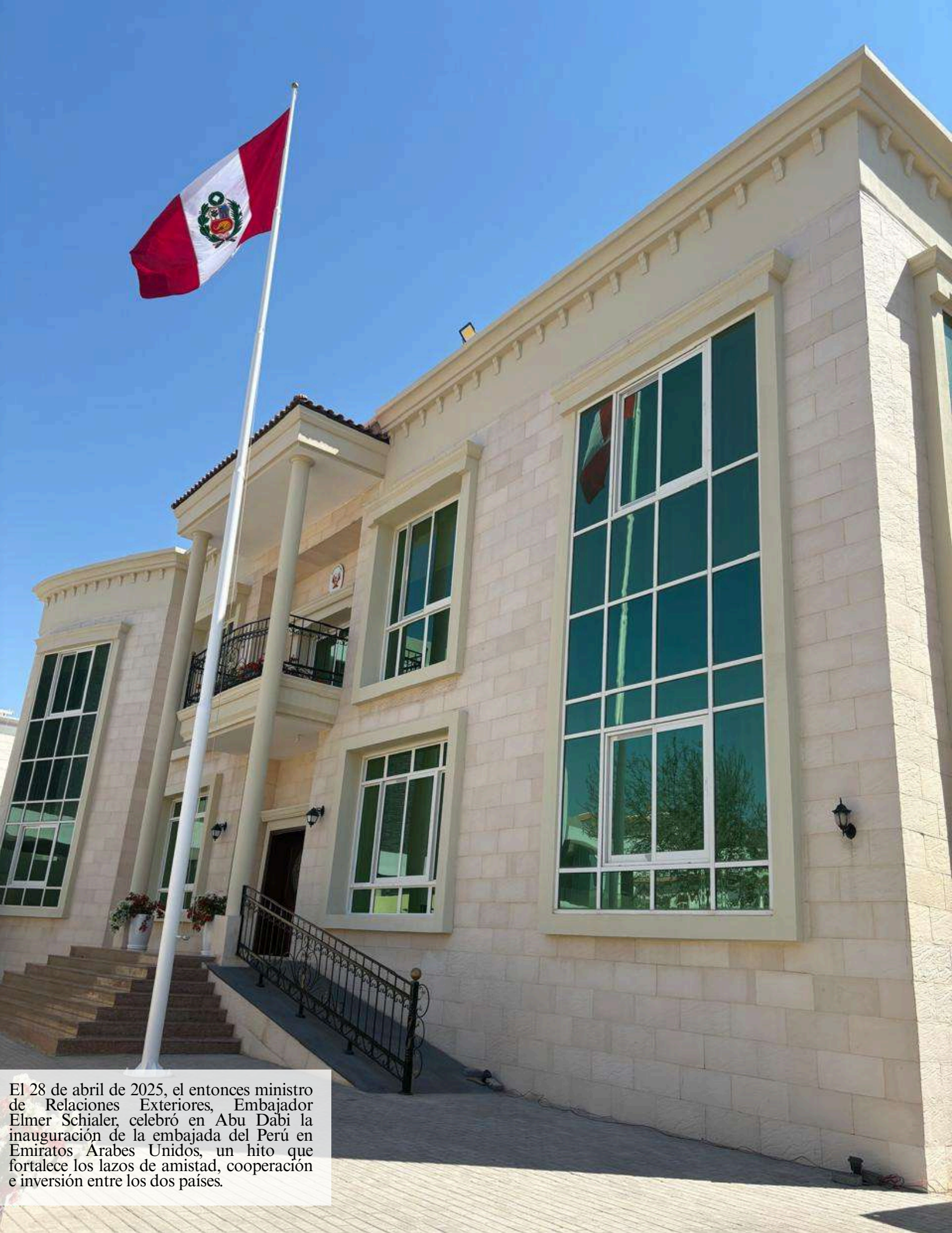
El 28 de abril de 2025, el entonces ministro de Relaciones Exteriores, Embajador Elmer Schialer, celebró en Abu Dabi la inauguración de la embajada del Perú en Emiratos Arabes Unidos, un hito que fortalece los lazos de amistad, cooperación e inversión entre los dos países.