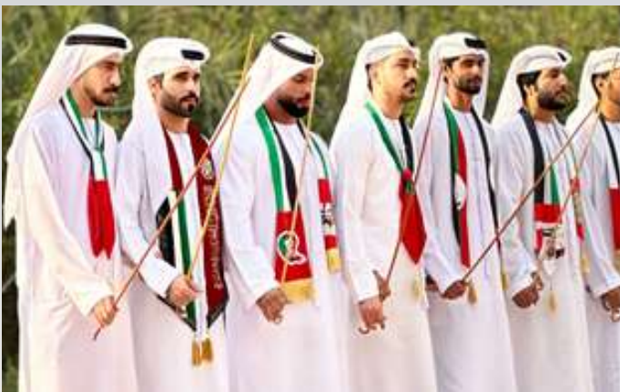
LA DANZA AL AYYALA, DECLARADA PATRIMONIO CULTURAL INMATERIAL POR LA UNESCO

El idioma árabe, es la piedra angular de la identidad nacional, mientras que el idioma inglés, se habla ampliamente, debido a que Emiratos Árabes Unidos alberga a más de 200 nacionalidades por su ubicación geográfica y su apertura económica. Esta diversidad lingüística y cultural, ha favorecido a los Emiratos Árabes Unidos para convertirse