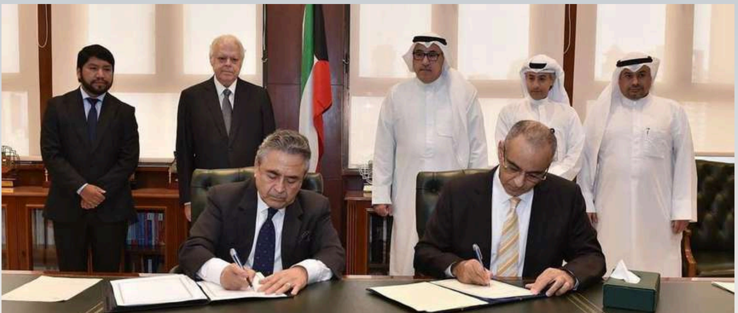
SUSCRIPCIÓN DEL “ACUERDO ENTRE LA REPÚBLICA DEL PERÚ Y EL ESTADO DE KUWAIT EN EL ÁMBITO DE LA CULTURA Y EL ARTE” EN EL MARCO DE LA I REUNIÓN DEL MECANISMO DE BILATERALES ENTRE EL PERÚ Y KUWAIT

En el caso del acuerdo cultural entre el Perú y Kuwait, éste compromete a ambos Estados a realizar cooperación en el ámbito de la cultura y las artes, fomentar el entendimiento mutuo, promover contactos directos en el campo de la literatura, las artes, el cine, la traducción, la arquitectura, museos, bienes culturales, archivos, entre otros.