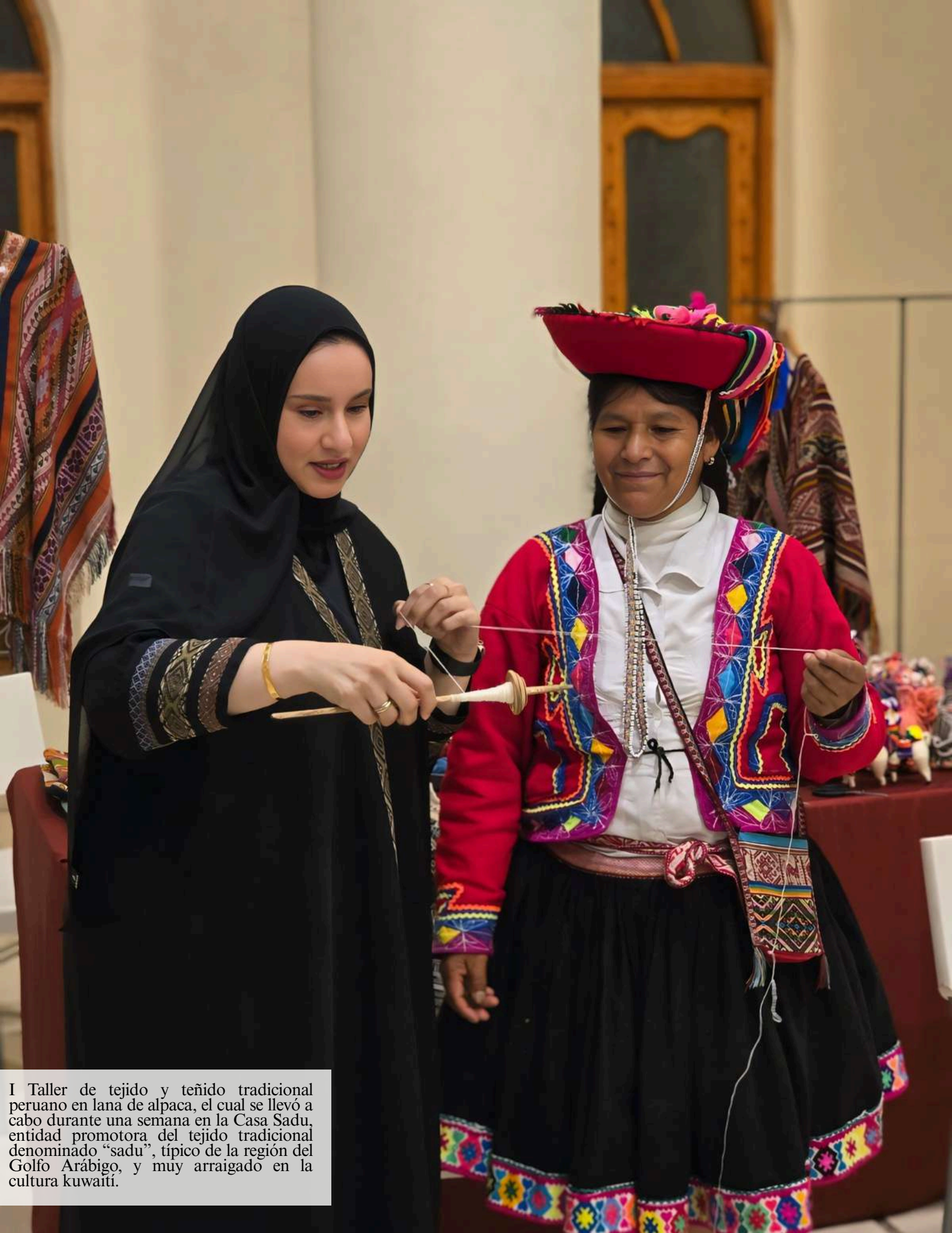
I Taller de tejido y teñido tradicional peruano en lana de alpaca, el cual se llevó a cabo durante una semana en la Casa Sadu, entidad promotora del tejido tradicional denominado "sadu", típico de la región del Golfo Árabe, y muy arraigado en la cultura kuwaití.