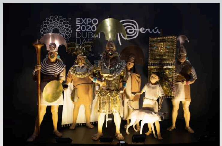
EXPOSICIÓN DEL SEÑOR DE SIPÁN EN EXPO 2020 DUBAI

Dicha exhibición permaneció hasta la noche del lunes 7 de enero de 2022, en que tuvo lugar la ceremonia de clausura con la asistencia de autoridades locales, Cuerpo diplomático y consular, prensa, artistas, así como connacionales residentes y público en general, además de la participación de nuestra consagrada artista Tania Libertad junto con las cantantes mexicanas Guadalupe Pineda y Eugenia León. Concluido el acto, los invitados fueron invitados al restaurante "Qoricancha" ubicado en la planta baja del pabellón peruano, a degustar una cena de gastronomía del sur peruano.