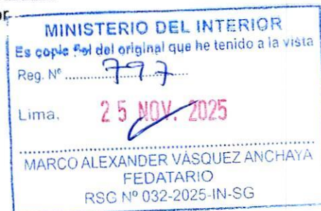
VICENTE TIBURCIO ORBEZO Ministro del Interior