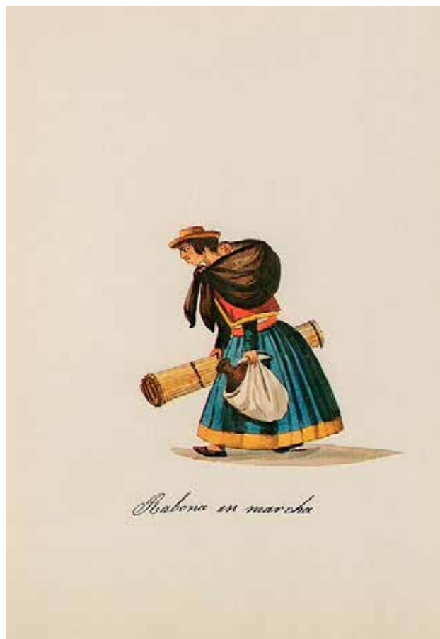
Pancho Fierro, s. XIX

Y le había cogido las trenzas con devoción mientras Yuriana repetía seis reales al día algo es, Iskayku. Si nomás, hasta el tuétano se habían encamotado ella huarmi aimara con el Iskay runa quechua, seguro así les habrá gustado ya también a sus Apus padrinos de ella que se arrejuntan para quererse collagua con cabana y tener sus guaguas. Y Maywa Tola y su hija Yuriana ignoraban en ese trance cuál de las dos estaba más plagada de dudas y aflicción junto a la dicha del amor que flotaba ligera ante sus ojos con las palabras. Su alegría era atropellada, salía a borbotones desde la tristeza más densa.