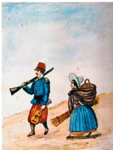
Pancho Fierro. Soldado y rabona, s. XIX

-Eso pues, ¿quién es el maldito espíritu de sedición, Iskayku ya también?, le pregunté rápido, ¿que así tanta defensa necesitan de él? No es un runa ni un jaqi ni tampoco un misti solito, Yurianacha, es un chuchonal de hombres de toda calaña el maldito espíritu de sedición, diciendo el sargento Begazo enfurecido. Harto runa y jaqi es, y unos cuantos mistis y mistiños, y a veces mistirunas y mistijaqis y jaqirunas es, toda una sarta de locos alucinados y con fusiles, si los consiguen ya también que no es fácil, o si de más antes tienen, o con cualquier arma blanca o de fuego que chapen, diciendo el sargento Begazo. Empatotados dice como hienas arremeten contra el orden y todo invaden, y saquean lo que se van encon-