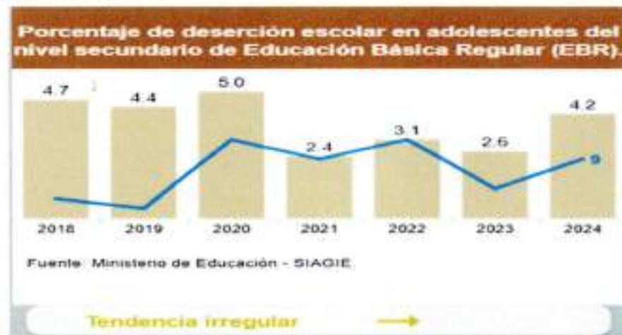
Gráfico N° 02: Porcentaje de deserción escolar en adolescentes del nivel secundario de Educación Básica Regular (EBR) en el distrito de Nueva Requena (2016-2024)

Fuente: Sistema de Información de Apoyo a la Gestión de la Institución Educativa (SIAGIE) – Ministerio de Educación (MINEDU), (2018-2024).