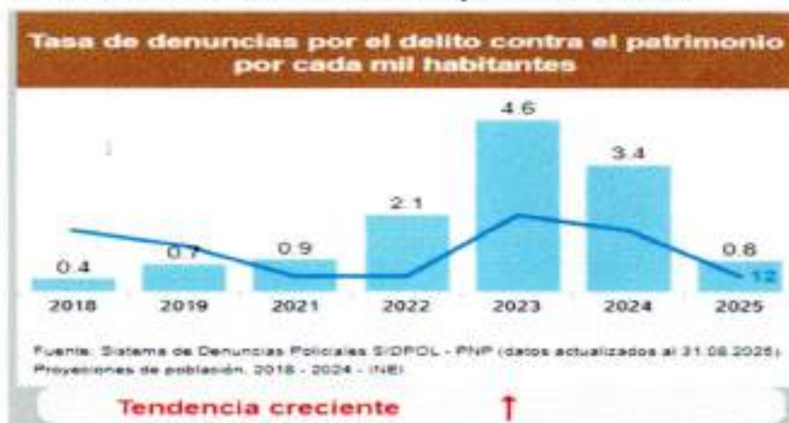
Gráfico N° 04: Tasa de denuncias por el delito contra el patrimonio por mil habitantes en el distrito de Nueva Requena (2018-2025).

Fuente: Policía Nacional del Perú – Sistema de Denuncias Policiales (SIDPOL), (2018-2025).