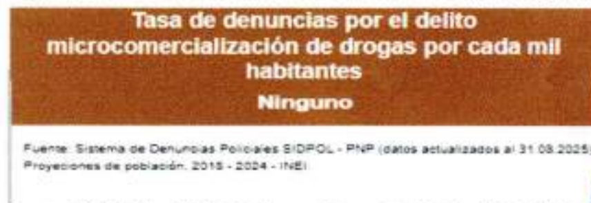
Gráfico N° 12: Tasa de denuncias por el delito de micro comercialización de drogas por cada mil habitantes en el distrito de Nueva Requena.