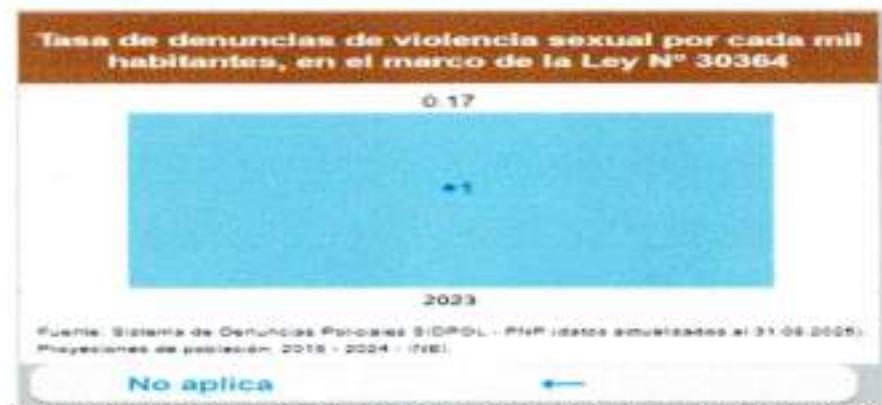
Gráfico N° 09: Tasa de denuncias de violencia sexual por cada mil habitantes, en el marco de la Ley N° 30364, en el distrito de Nueva Requena (2018-2024).

Fuente: Policía Nacional del Perú – Sistema de Denuncias Policiales (SIDPOL), (2018-2024)