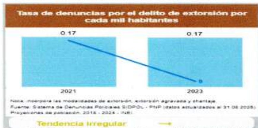
Gráfico N° 11: Tasa de denuncias por el delito de extorsión por cada mil habitantes en el distrito de Nueva Requena (2018-2025).

Fuente: Policía Nacional del Perú – Sistema de Denuncias Policiales (SIDPOL), (2018-2025).