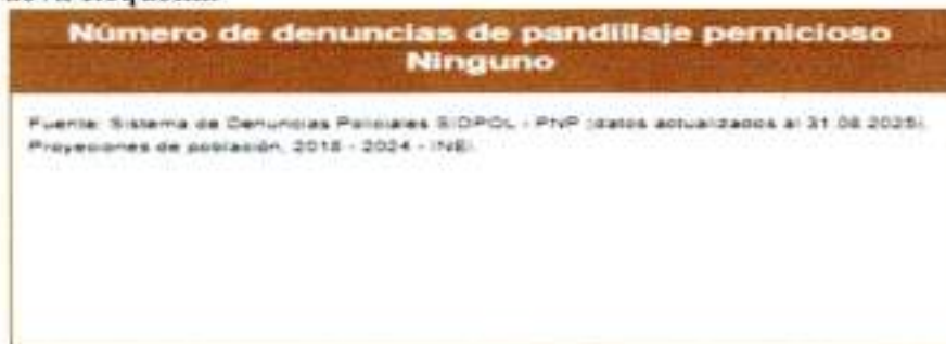
Gráfico N° 03: Número de denuncias por pandillaje pernicioso en el distrito de Nueva Requena.

Fuente: Policía Nacional del Perú – Sistema de Denuncias Policiales (SIDPOL), (2018-2024).