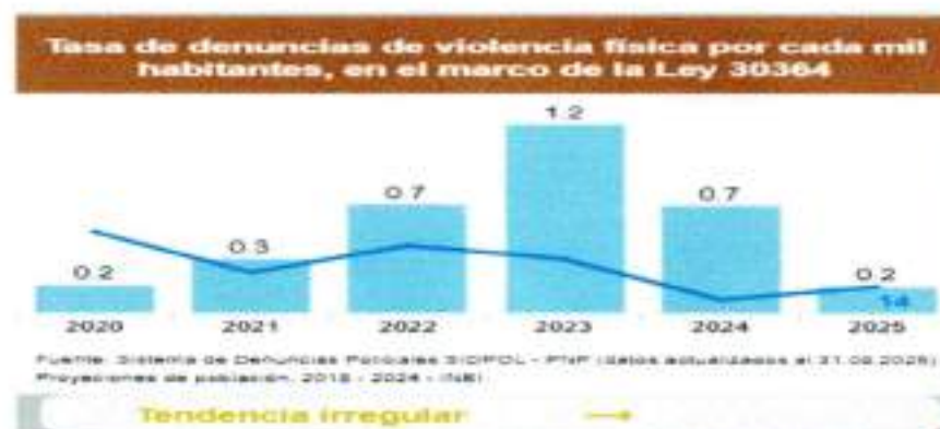
Gráfico N° 07: Tasa de denuncias de violencia física por cada mil habitantes, en el marco de la Ley N° 30364, en el distrito de Nueva Requena (2020-2025).

Fuente: Policía Nacional del Perú – Sistema de Denuncias Policiales (SIDPOL), (2020-2025).