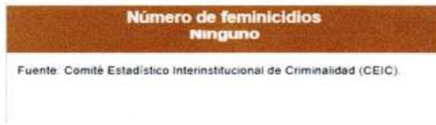
Gráfico N° 06: Tasa de feminicidios en el distrito de Nueva Requena.