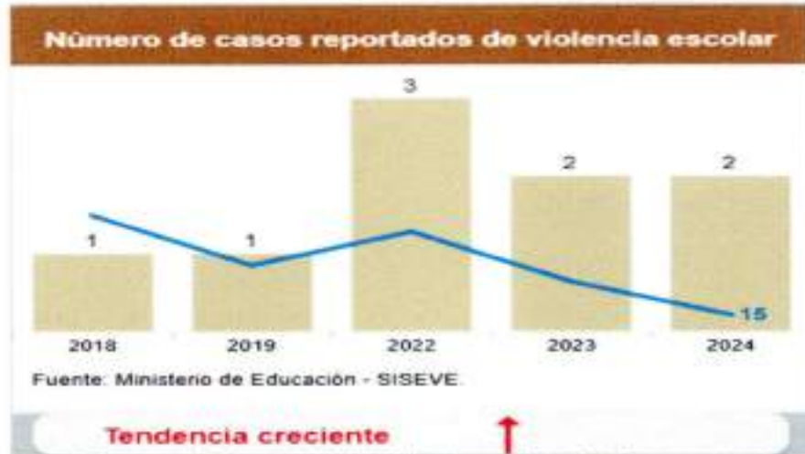
Gráfico N° 01: Número de casos reportados sobre violencia escolar en el distrito de Nueva Requena (2018-2024).

Fuente: Ministerio de Educación (MINEDU) – Sistema Especializado en reporte de casos sobre violencia escolar SISEVE, (2018-2024).