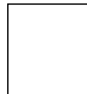
Huella digital (Índice derecho)

Declaro tener conocimiento de los alcances, del TUO de la LPAG, la información que consigno en el presente documento es real y veraz, en caso de detectarse fraude o falsedad, me someteré a la sanción que establece la Ley.