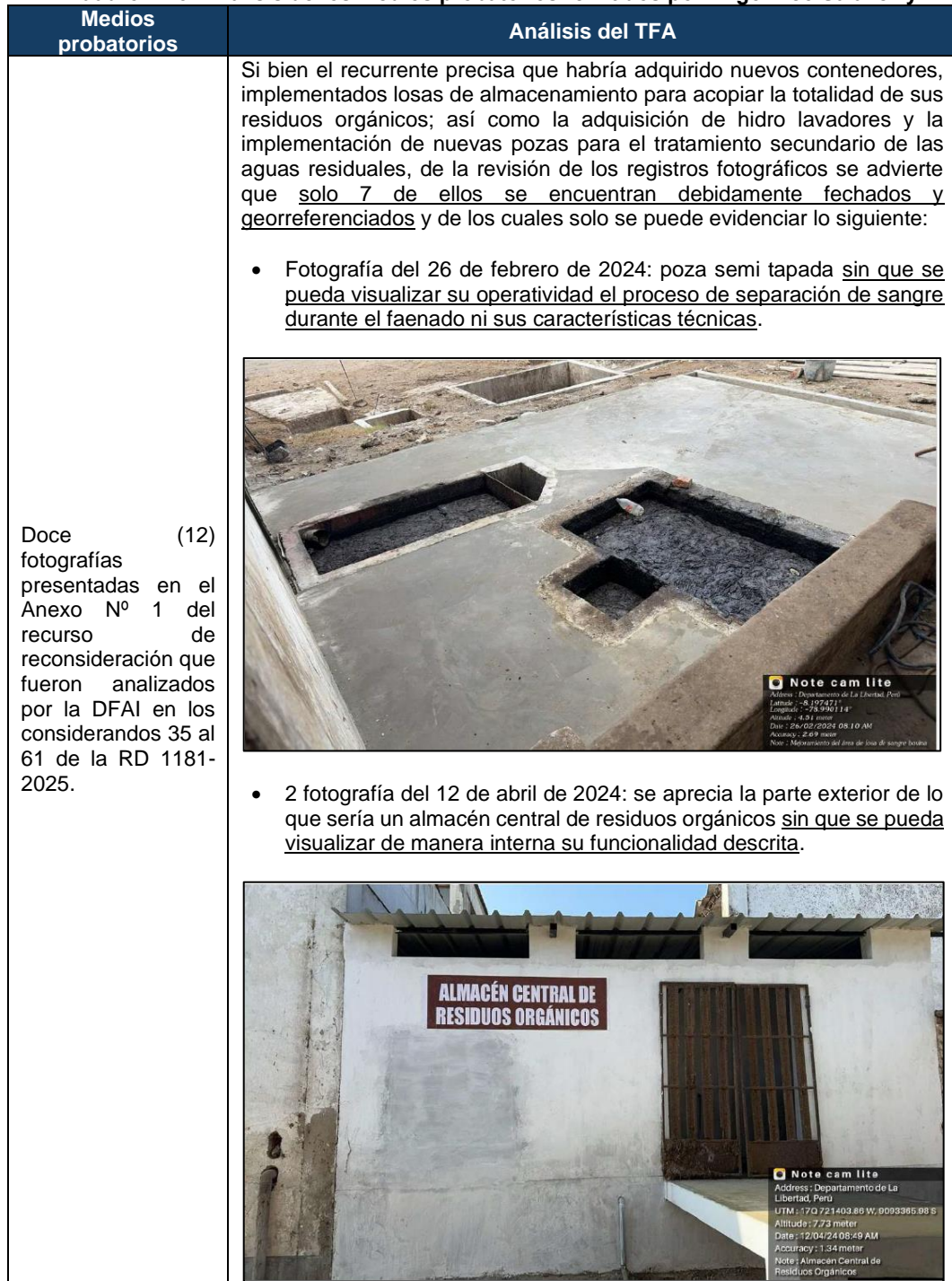
Cuadro N° 3: Análisis de los medios probatorios remitidos por Frigorífico Salaverry