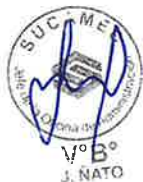
RELACION DE SERVIDORES DEL MANEJO DE CAJA CHICA DE LOS ORGANOS DESCONCENTRADOS DE LA SUCAMEC AÑO 2026