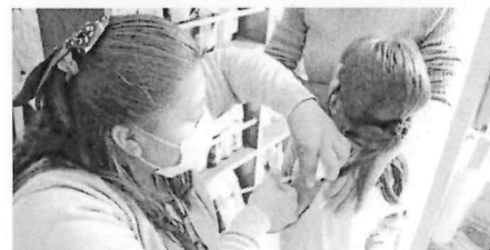
■ Riesgo de importación y transmisión de enfermedades.

talecerá las capacidades del personal de salud en la identificación de casos sospechosos, fortalecimiento y monitoreo de los laboratorios y la asistencia técnica para la organización y funcionamiento de los servicios de salud para la atención de pacientes. ▲