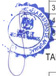
TABLA N° 05: ESCUELA PROFESIONAL DE INGENIERIA DE MINAS FILIAL HAQUIRA