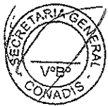
DARÍO PORTILLO ROMERO PRESIDENTE CONSEJO NACIONAL PARA LA INTEGRACIÓN DE LA PERSONA CON DISCAPACIDAD